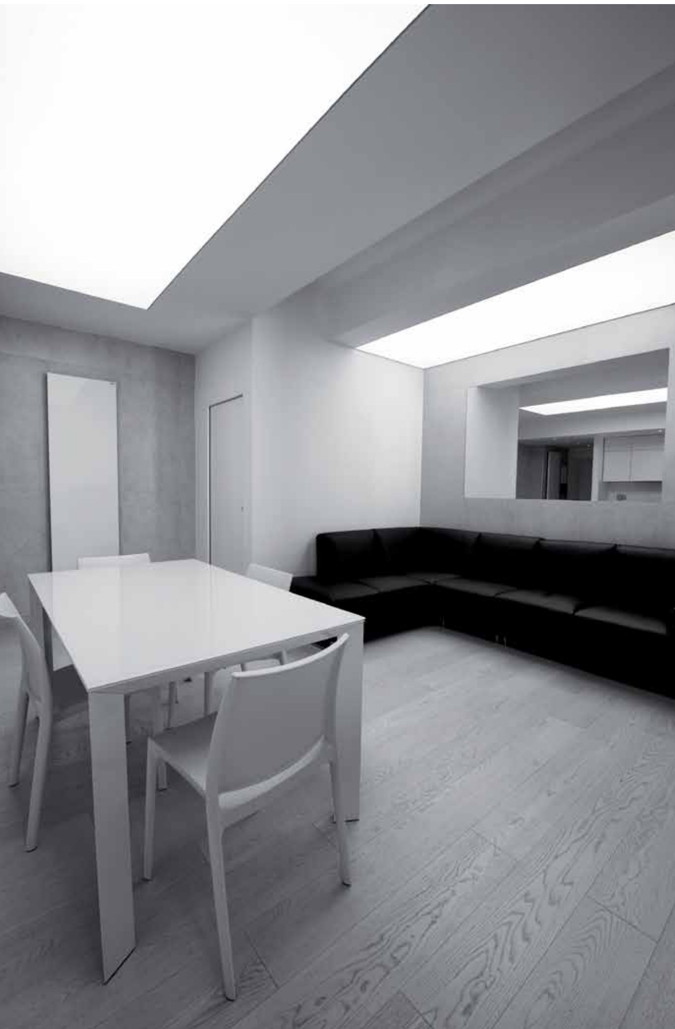
In evidenza, il telo retroilluminato che caratterizza il controsoffitto; pianta ante operam e post operam