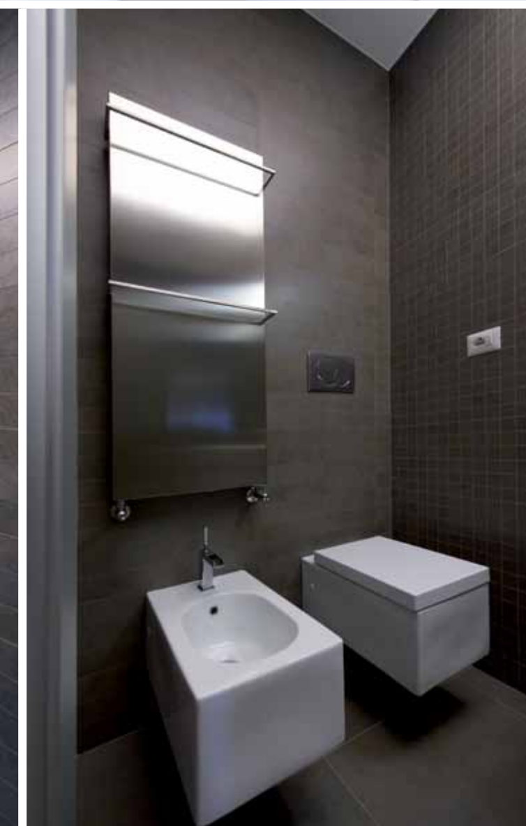
Il rivestimento del letto e le superfici ceramicate dei bagni contrastano fortemente il candore omogeneo dell'interno